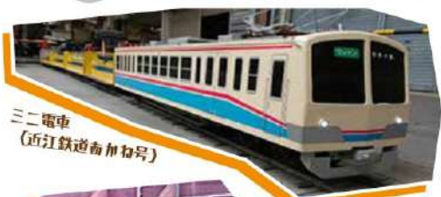
三二電車 (近江鉄道南加那号)