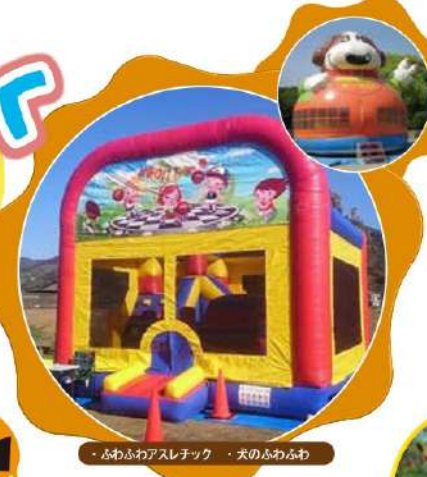
ふわふわアスレチック ・ 天のふわふわ